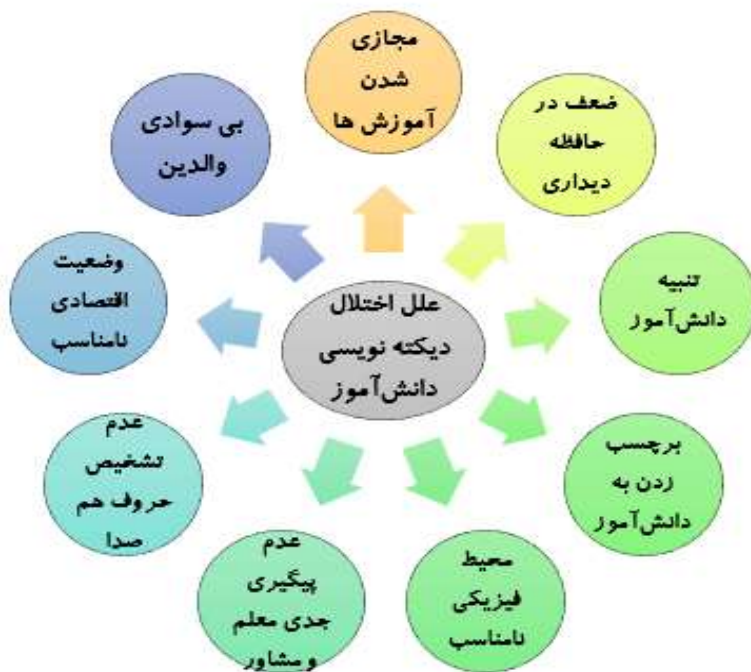
نمودار ۱: بررسی علل اختلال دیکته نویسی دانش‌آموز مورد نظر